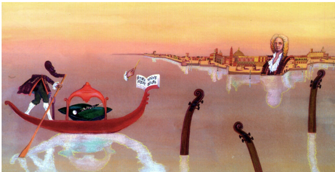
Ilustrații realizate de Devis Grebu