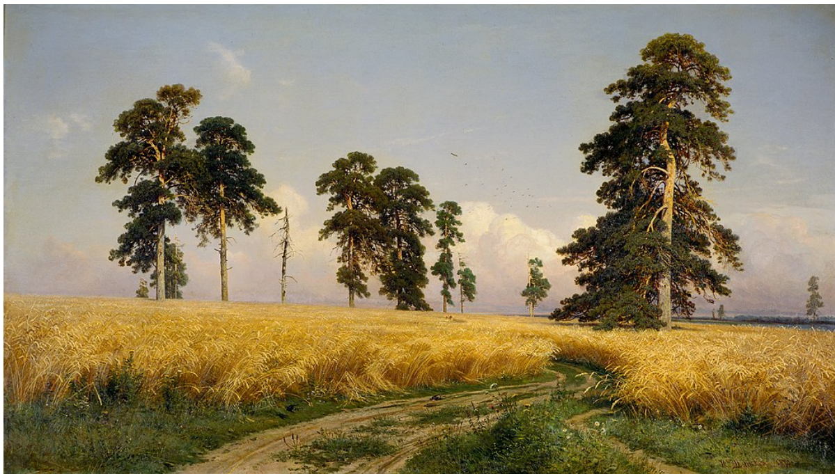
„Secară”, de Ivan Şişkin

Concomitent cu cea a armatei plantatorilor se desprind și istoriile de dragoste, una veche, încercînd timid să se reînnioască, alta, o neașteptată binefacere. La mijloc, un copil cu trei părinți, născut ca o armă, iubit ca o necesitate. „Pe vremea când viața era viață, nu moarte”, era Grinda. Iar când ești pur și simplu, micile artificii scoase la nevoie din pălărie pentru o cârpeală aici, una dincolo, mai ales pentru iubirile care îți sînt încă legate simbiotic, sînt doar povești pentru bătrânii nevorbiți. Întregul roman e cuprins de o calmă stranietate, e plin de un du-te-vino, o apropiere, apoi o distanță, care te fac să nu poți privi altfel decât straniu și pieziș. Ne aduce, poate, din nou la capăt, la capătul șirului de romane, adică la Aproape a șaptea parte din lume , cu care cercul, miraculos, aproape se închide.