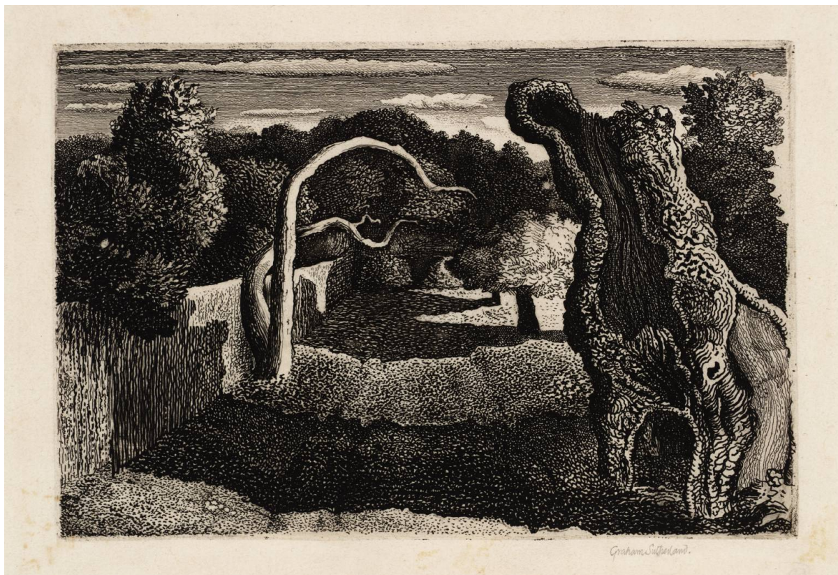
„Pastoral”, de Graham Sutherland