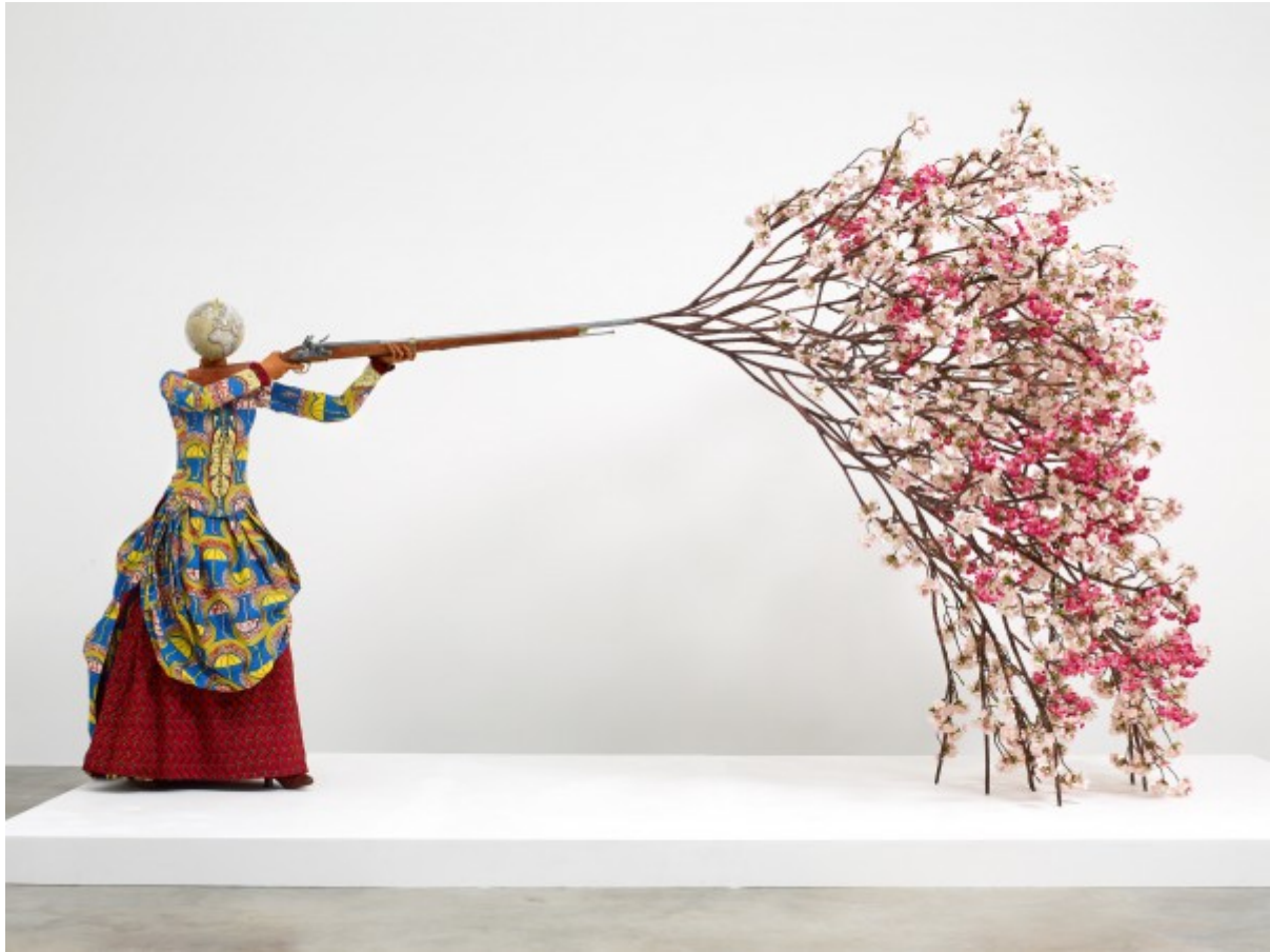
„Woman shooting cherry blossoms”, de Yinka Shonibare