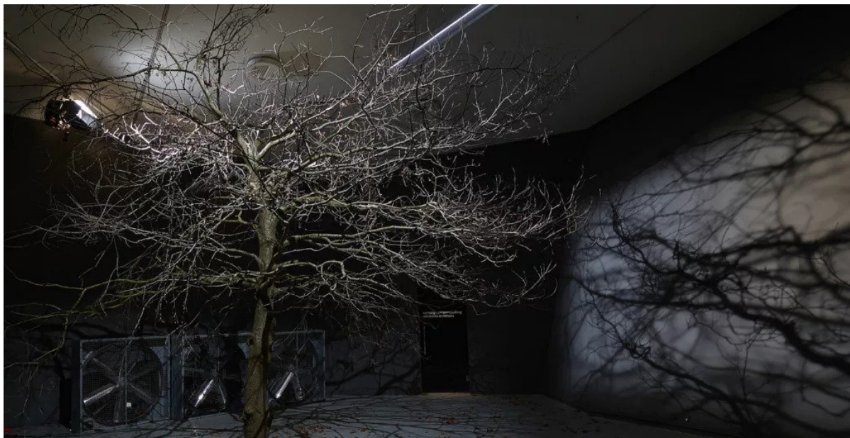
Instalație din expoziția „Bélla Tarr. Till the end of the world”, Eye Filmmuseum

Roman de dragoste și/sau distopic (care se termină totuși cu o eucatastrofă, veți vedea în carte de ce), Toate greșelile vobește despre două lumi care par inițial că se consumă reciproc, dar apoi se întretaie, un final intim reluat cu speranța unui nou început și un început cu totul nou apărut de te miri unde. Protagonistul Radu Grinda, un traducător și interpret când zăbăuc și de inimă ușoară, când de o intensitate sensibilă dezarmantă, se trezește într-un București în care toți copacii naturali sunt înlocuiți de copaci electrici. Ajunge să adere la un grup disident numit „armata plantatorilor de copaci”, atât de abtîr dedicată distrugerii afacerii arborilor artificiali că experiența seamănă mai mult cu prizonieratul de lagăr decât cu acțiunea colectivă a unor voluntari. În ciuda a ceea ce s-a vehiculat, nu cred că există la mijloc nicio miză ecologistă. În schimb, cred că este vorba de un țesut conjunctiv care leagă niște timpi dezarticulați. Puțini dintre noi pot obiecta chiar la adresa ororilor naturii; și pentru ochiul cu veleități idealizante, lumea naturală pare un receptacol cu vestigii nelimitate de frumusețe, sau, mai bine zis, numai de frumusețe. Copacii leagă și dezleagă; plecînd din oraș, ne iau o puternică certitudine necesară: frumusețea și viața sînt aici și sînt constante, acum te poți debarasa de povara speranței.