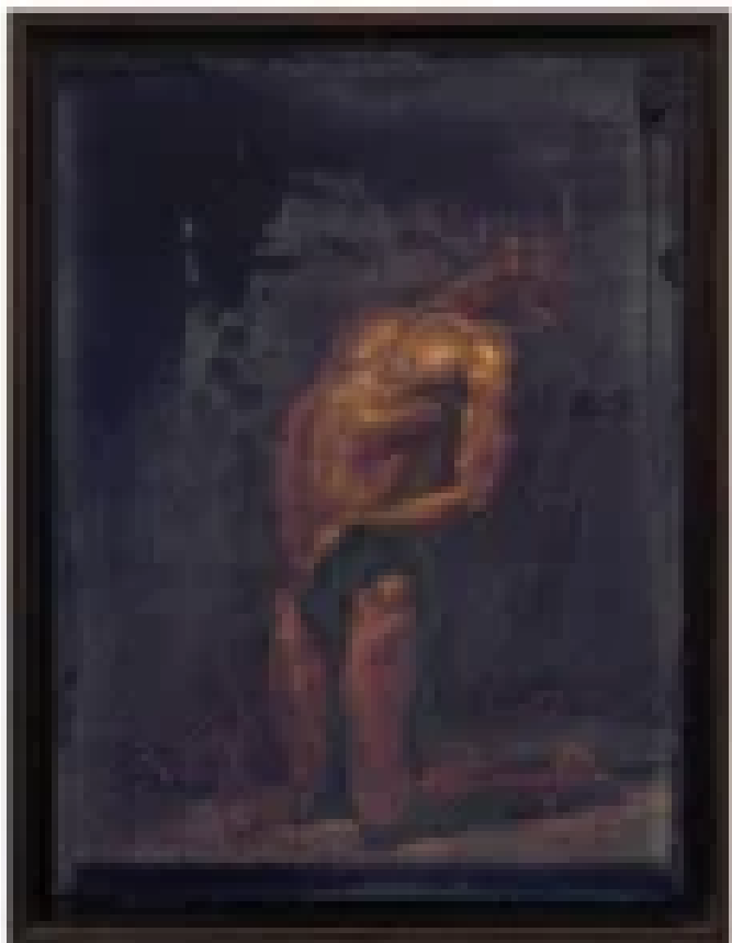
„Agonia Quadriptyc” – Ellen Marie Moysons